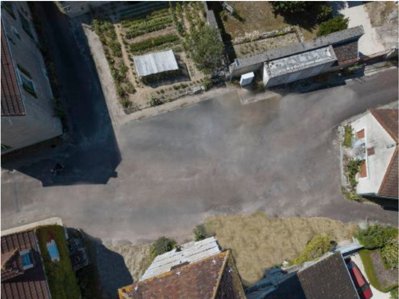
Simulation de la place sans parking...